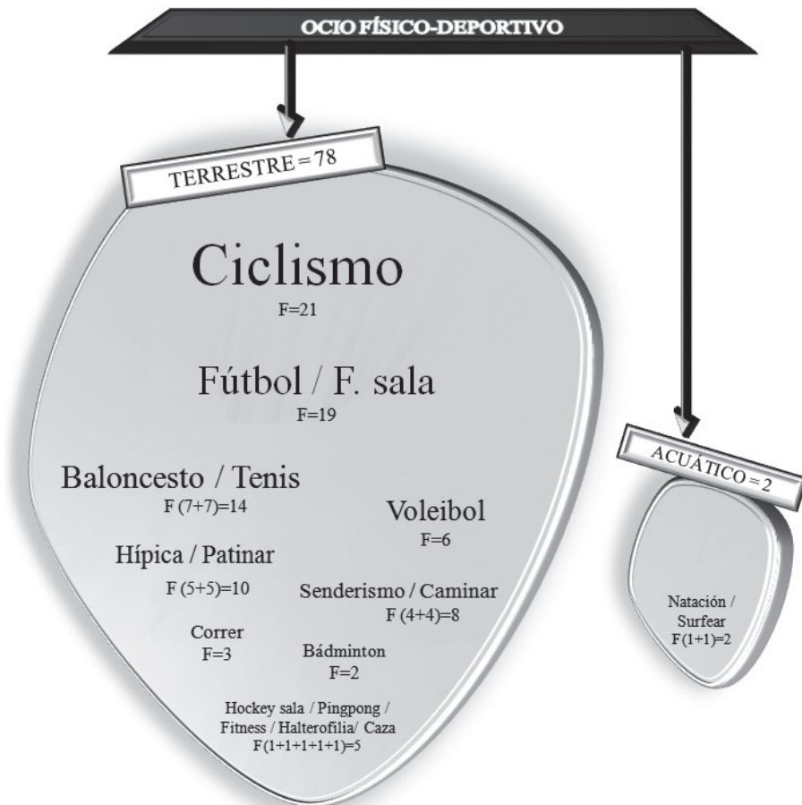
Figura 3. Tendencia en las actividades de ocio físico-deportivo.

Algunos/as participantes plasman que abarcan un abanico amplio de prácticas físico-deportivas en su tiempo libre (figura 3). De hecho, en los deportes que realizan llama la atención su diversidad, aunque existe la tendencia por disfrutar de los terrestres, como el ciclismo y el fútbol o el fútbol sala. También el colectivo presenta cierta preferencia por jugar al baloncesto, tenis y voleibol; de forma excepcional disfrutaban del patinaje y de la hípica. Cabe indicar que una minoría se decanta por el bádminton, el ping-pong o el hockey. De modo ilustrativo se presenta el siguiente fragmento: